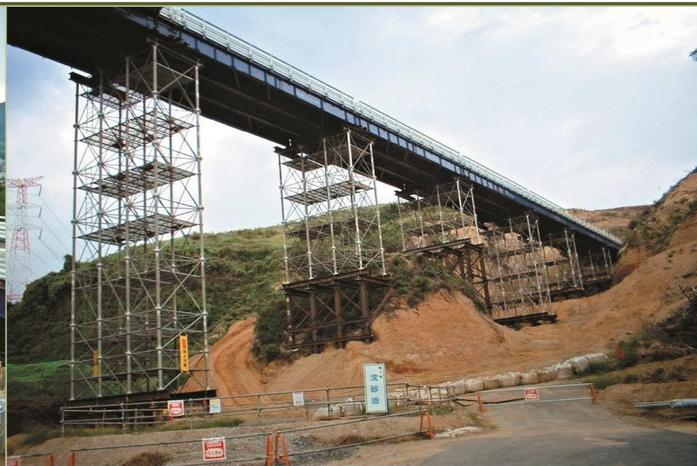
上 紀北東道路 高野口IC工用仮設栈橋 (和歌山県 橋本市 高野口) 工用仮設道路の規模は 橋長 162m、高さは杭頭部より16.1m、幅員6m、縦断勾配3.9% 元請様に於いて、H鋼材との比較検討に於いて、工期の短縮、作業の安全性、経済性、そして後のスクラップ発生等々を総合的に削減することが出来ると判断されて、ご採用頂きました。 下 神戸淡路鳴門自動車道 茶間川本線橋仮橋 (兵庫県 淡路市 岩屋町茶間) 工用仮設道路の規模は 橋長 180m、高さ 40m 仮設中にほぼ直下を震源とする「阪神淡路大地震」が発生、両側のアハットとの間が30cm程接近しましたが、無事に持ち堪える事が出来ました。更に安全確認後、特に補修も無く工事はすぐに再開されました。