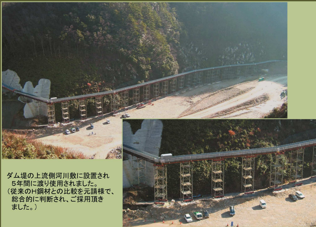
下：ダム建設用仮設水路 島根県 飯南町 （設置高 3m~13m、設置延長290m、水路断面1.2mX0.95m）

ダム堤の上流側河川敷に設置され 5年間に渡り使用されました。 （従来のH鋼材との比較を元請様で、 総合的に判断され、ご採用頂き ました。）